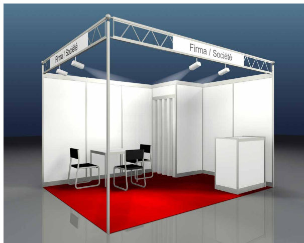
Beispiel: BUDGET, 12 m 2 Eckstand