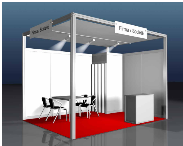
Beispiel: COMFORT, 12 m 2 Eckstand