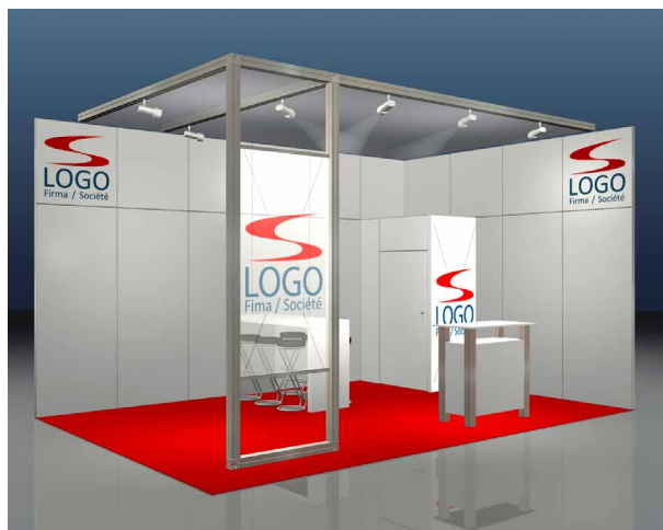
Beispiel: DELUXE, 24 m 2 Eckstand